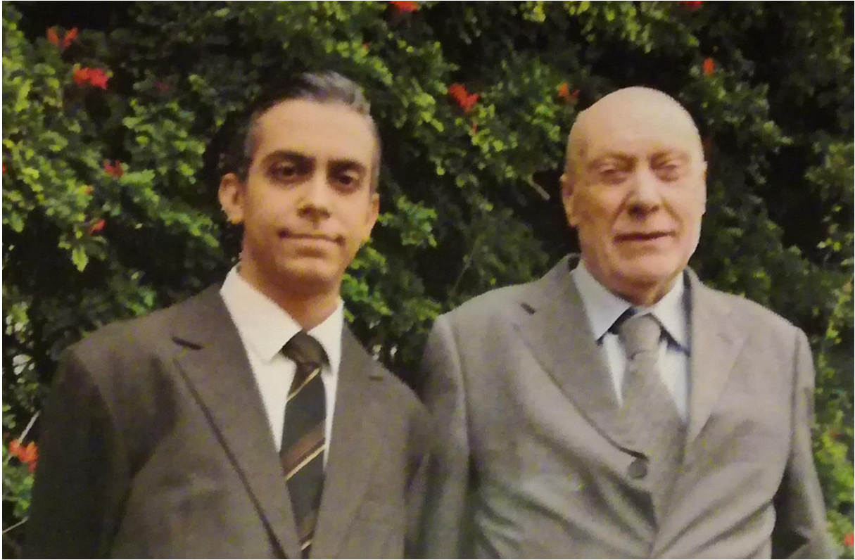
Foto di Ettore Majorana del 5 agosto 1996, assieme a Rolando Pelizza, costruttore della macchina che ha permesso di sperimentare le ipotesi teoriche di Ettore.